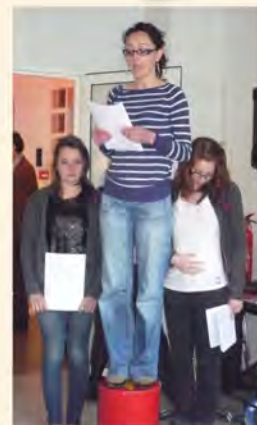
Lecture théâtralisée par les élèves du Conservatoire Massenet.