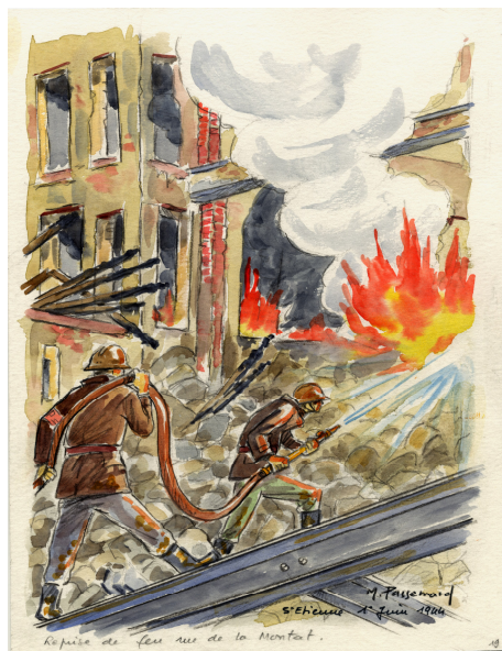
Reprise du feu, rue de la Montat, 1er juin 1944.