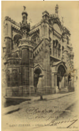
2Fi icono 975

La série des cultes, la plus modeste de notre fonds (2 ml environ), a été revue entièrement pendant la semaine de fermeture courant juin 2003.