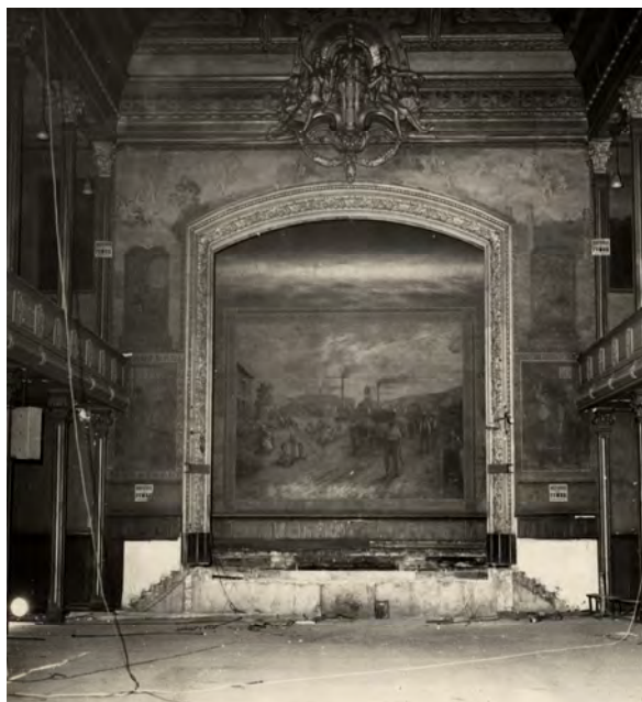
Fresque peinte par Auguste Berthon en 1908, aujourd'hui masquée par le mur de scène.

A l'occasion du centenaire, la grande salle des fêtes, appelée aussi « salle de conférences », fermée au public, va rouvrir ses portes du 18 septembre au 2 octobre pour accueillir une exposition « Solidarités. La Bourse du Travail a 100 ans ! »